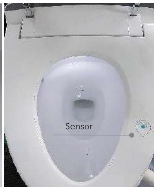
Área de sensado por presión para la activación del sistema. Función de luz nocturna incorporada.