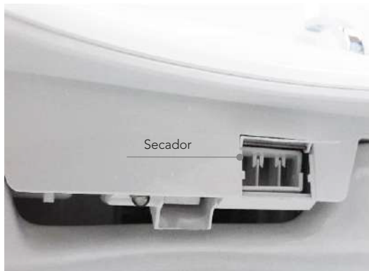
Función de secado con aire caliente. (5 opciones de temperatura)