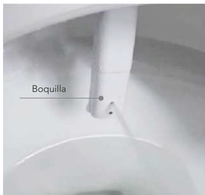
Función de lavado delantero o trasero de modo manual o automático. (3 opciones de temperatura del agua)