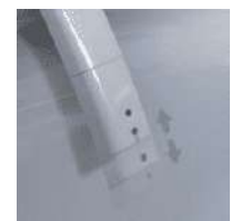
Lavado en movimiento

Limpieza multidireccional y multimodo, siente diferentes experiencias de lavado. Multidirectional and multi-mode cleaning – experience different wash sensations.